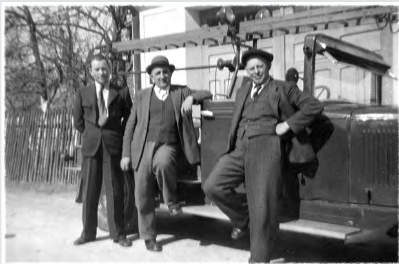
Automobil Škoda 206

V roce 1946 si sbor pořídil z továrny z Adamova starší motorovou stříkačku a také automobil. Stříkačka byla zn. Neugebauer & Hrček a automobil zn. Škoda 206. Oba stroje si však členové sboru svépomocně opravili a především automobil musel být celkově přestavěn na převoz techniky a mužstva.