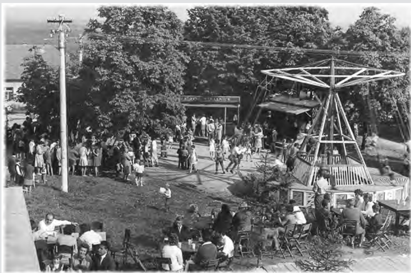
Výletišťe v Malé Veselici

vycházkové uniformy a další drobný materiál. Požární materiál, jako hadice, savice, apod., jsou uloženy na kovovém regále, ve zbrojnici je prostor i na přívěsný vozík za požární automobil Ford Transit. Po straně zbrojnice jsou umístěny dva stroje PS12 a jeden PS8. Poháry za dobré výsledky v různých požárních soutěžích jsou vystaveny v uzavíratelné prosklené skříni.