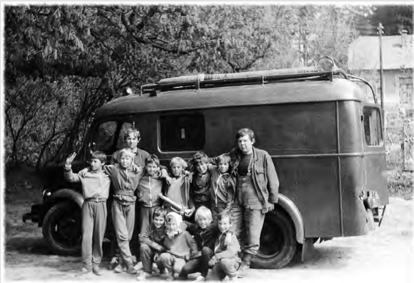
Družstvo mladých hasičů v roce 1987

přes obec. Vedle toho se v posledním období členové sboru podíleli např. na demolici rodinných domů čp. 13 a 39 ve Veselici, chodí do lesa pálit klest po těžbě dřeva a vykonávají dle potřeby další práce. Pro své členy a příznivce výbor sboru zorganizoval v posledním období např. zájezdy s návštěvou přečerpávací elektrárny Dlouhé stáně v Jeseníkách, do Olomouce a okolí s návštěvou Hasičského muzea v Čechách pod Kosířem (2002), na hrad Pernštejn s návštěvou Pivovaru Černá Hora (2003) apod.