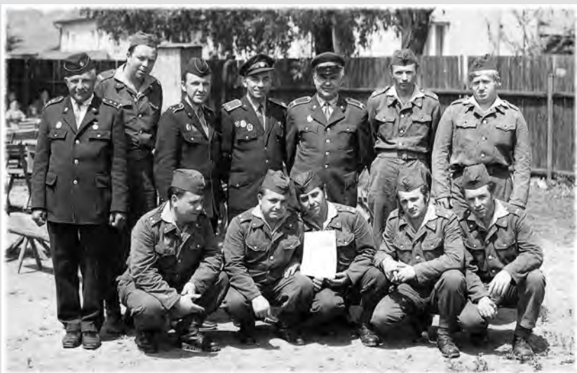
Družstvo sboru v roce 1967

Sbor pravidelně jednou za dva roky pořádá tradiční Svatoantonínskou pouť a Ostatkový průvod obcí. Ve spolupráci s Osadním výborem Veselice pořádá sbor v letech 2003 – 2007 soutěž „ Běh na rozhlednu “, která byla v roce 2001 zbudována na kopci Podvrší u Veselice. V roce 2004 zajišťovali členové sboru, jako traťoví komisaři, automobilovou soutěž Autotec Rally 2004, vedoucí